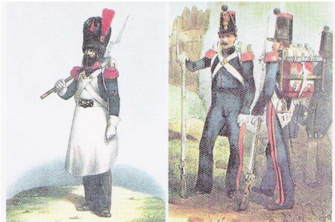
*Sappeur van de Linie-infanterie, 1831 en Sappeur-Minneurs, 1833*

Getalsterkte: 4 officieren en 221 manschappen