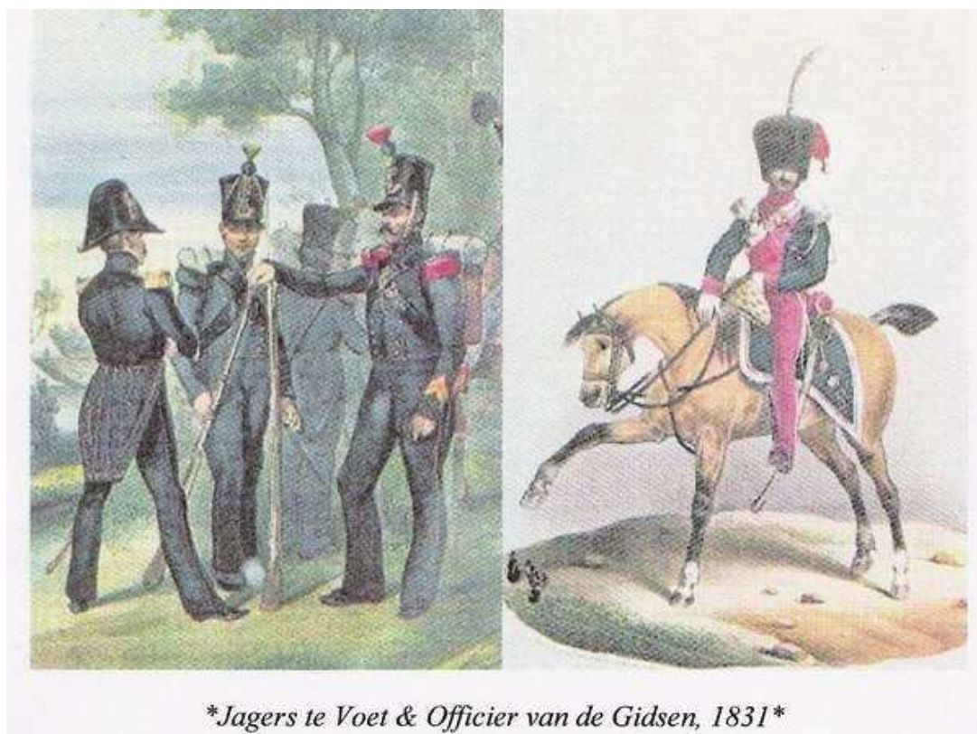
*Jagers te Voet & Officier van de Gidsen, 1831*