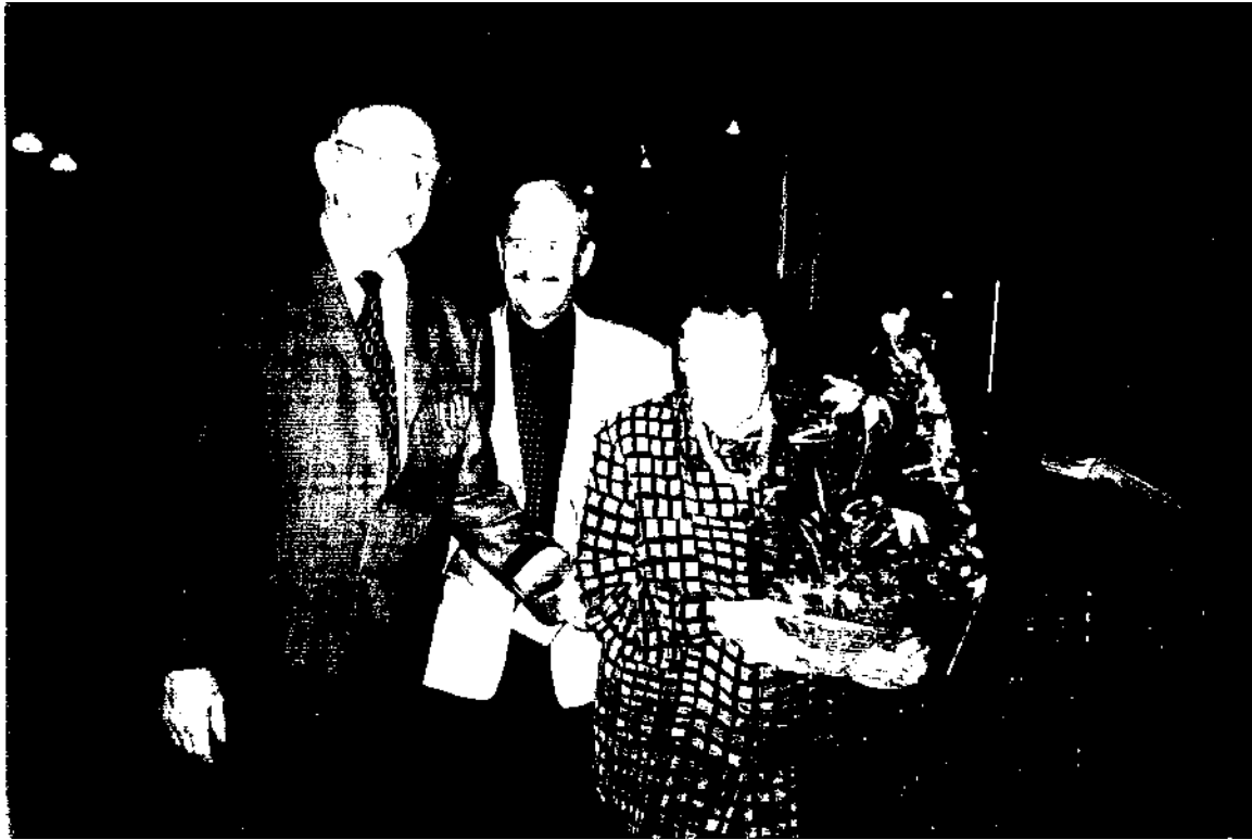
De erkenning van onze raad der wijzen voor hun jarenlange inzet als bestuurslid